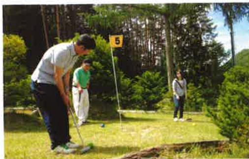
春の浪合で親睦を深める支会員の皆さん

会合を持ち、七月十二日には白竜神社まつりを実施することができました。これを機に地域の「昔」を掘り起こし楽しみを増やしたいと思っています。 又、街路灯・防犯灯としての在り方とともに今後検討してまいりたいと思っています。