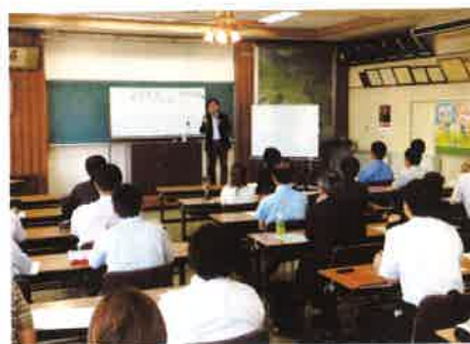
立石先生の熱い講義に聴き入る青年部員ら

に二回のセミナーを開催。ど んぶり勘定からの脱却、事業を継ぐ覚悟をすることの大切さを学びました。