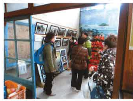
元銭湯でおひなさまを展示

織して、具体的な事業計画を立てて事業を実施していきます。その他、村や観光協会と連携して、「観光をプラットフォームにした産業振興」という村の産業振興の方針とベクトルを合わせ、村全体の観光振興に資する事業を実施していきたいと考えています。