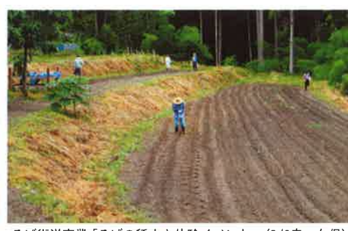
そば街道事業「そばの種まき体験イベント」(8/3鬼ヶ久保)

「遊休荒地対策を兼ねたそば街道事業」は、遊休荒地の有効活用でそばを栽培し、更に「そばの種まき体験」「そばの花見体験」「そばの刈り取り体験」「そば打ち体験」という長期待験イベントを実施するという事業です。