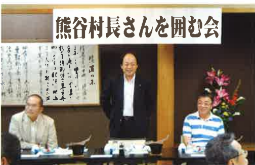
活発に行われた意見交換

ました。新村長は智里の出身でもあり、商工会議所にお勧めであったりと、商工会には何かと縁のある方であるということから、村長を囲んで意見交換をしてみようということになりました。早速七月四日に実施しました。お忙しい中、村長もかけつけていただき、大勢の会員の方の参加をいただき、盛大に開催できました。