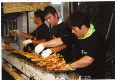
天候に恵まれ大忙しの青年部

また身近なところでは、商工会本会の事業にも青年部員が積極的参加を試みようと思っています。その例としまして、