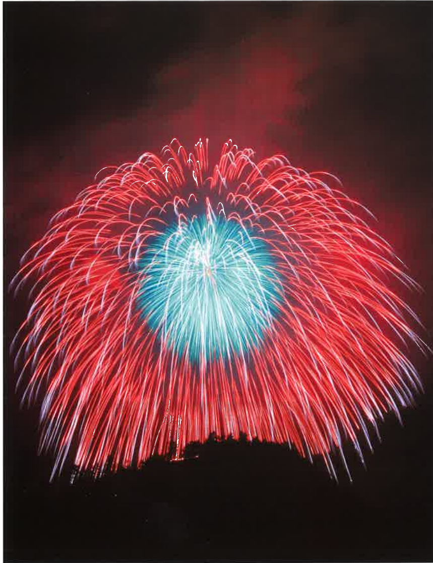
やまあいには響き渡る、二尺玉初登場

URL: http://www.achimura.com/ メール: info@achimura.com