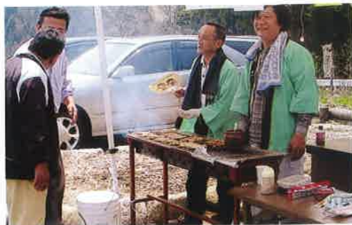
健康の森で盛り上がった花桃祭

清内路支会では、例年五月三日に健康の森主催の花桃祭に売店を出しています。今年も焼鳥、フランクフルトなど会員五名ほどで朝九時から夕方三時まで売りました。今年も天気もよく昨年よりも入込みが多かったようで、焼鳥な