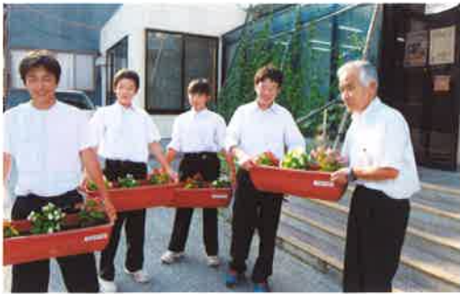
この花で駒場の街を元気に