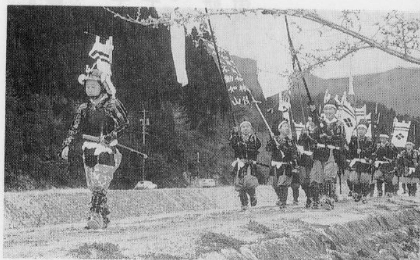
小学生による若武者

(三献の儀) 戦国時代、武將は武運を祈る為、陪膳所役(配膳係)が高杯(お盆)の上に、打鮑・勝栗・昆布の三種の肴をのせ総大将に献上する。打鮑は敵を打つ、勝栗は敵に勝つ、昆布は勝って喜ぶの意味がある。