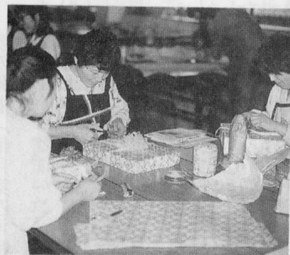
リボンをかけて完成

包装技術では、日常何気なく包装している物も、包み方により、美しく、豪華になる事を学び、又、丸い物や形が変わった物の包装は、聴講者も初めての様子で、改めて色々な包装の仕方に感心しておりました。