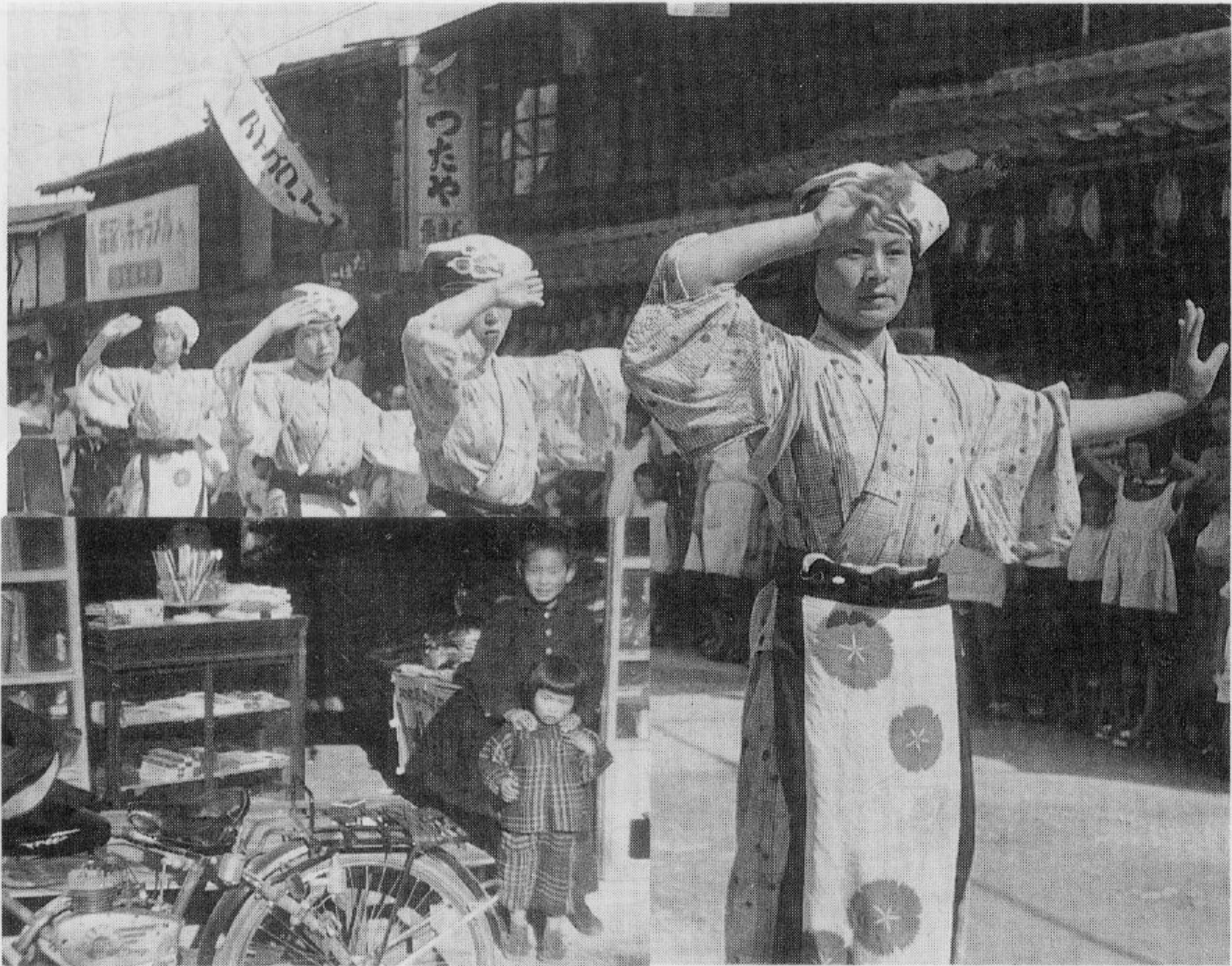
当時の現金屋さん店舗、原付バイクがなつかしい