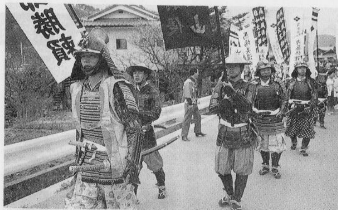
武田勝頼と武者達