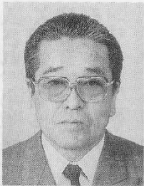
理 事 杵 鞭 輪 店 杵 鞭 邦治