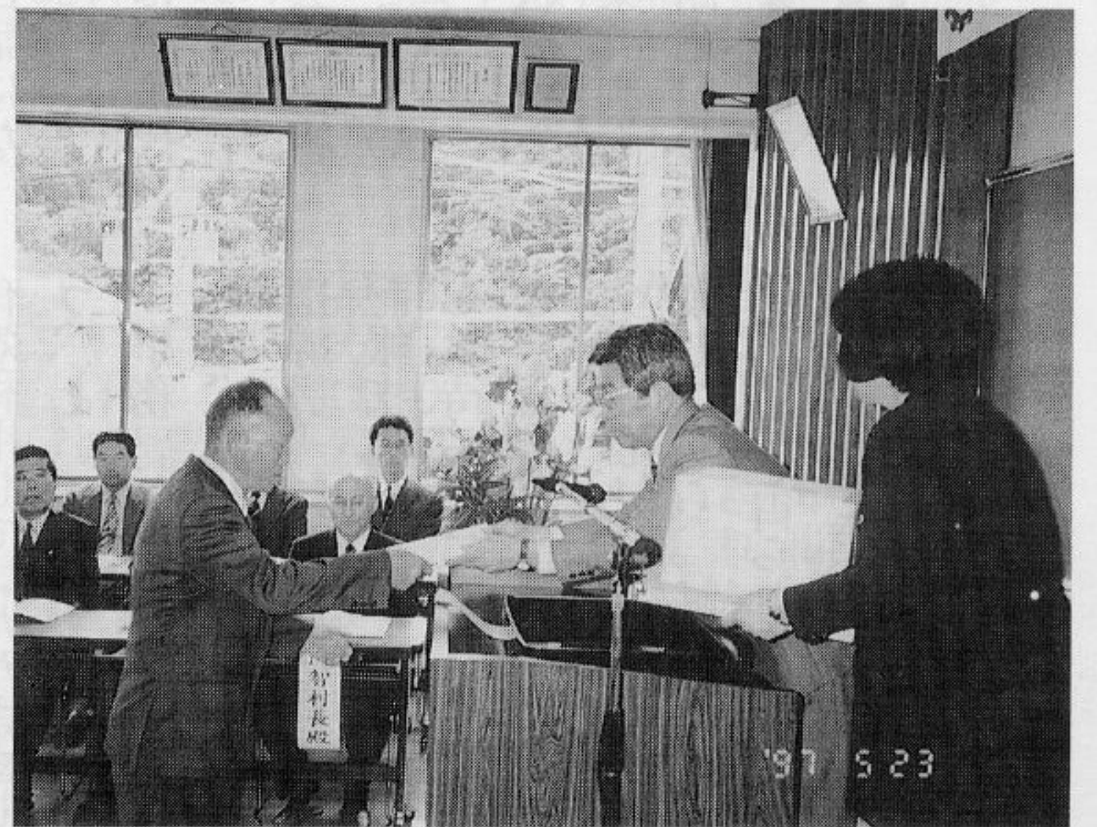
表彰を受ける永年勤続従業員