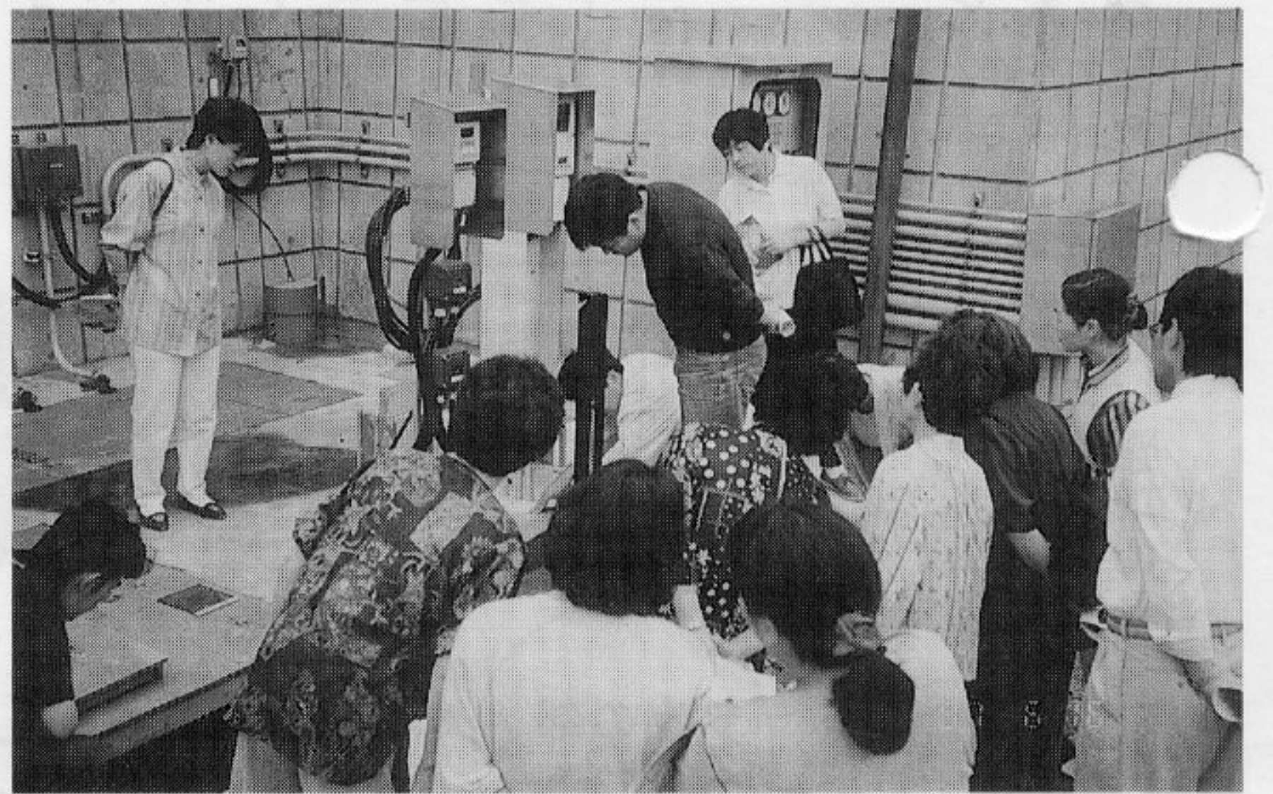
浄化された水の透視度を測定している

六月十六日、婦人部の事業として青年部と合同で、昼神の浄化センターを見学させていただきました。建物の外観がホテルの様な感で、総経費二十一億とか言っていました。 役場水道課の方の説明で、平成九年三月三十一日に供用開始し、十六日現在四百mの水処理をしている。ホテルの四分の一がすぎ込まれ、一般家庭では十件