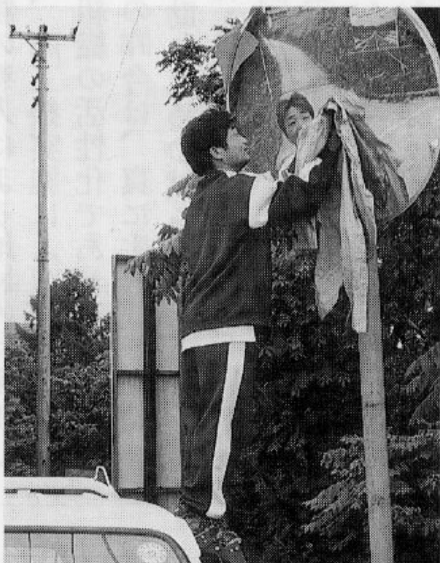
カーブミラー磨きに汗ながす会員

反省点としては、幾分参加人数が少なかつた気がしますので、内部努力で今後の活動を盛り立てていきたいと思えます。