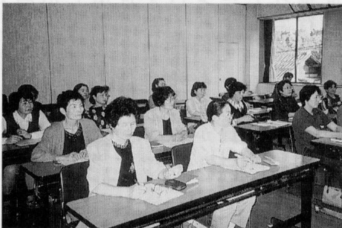
真剣に受講する会員