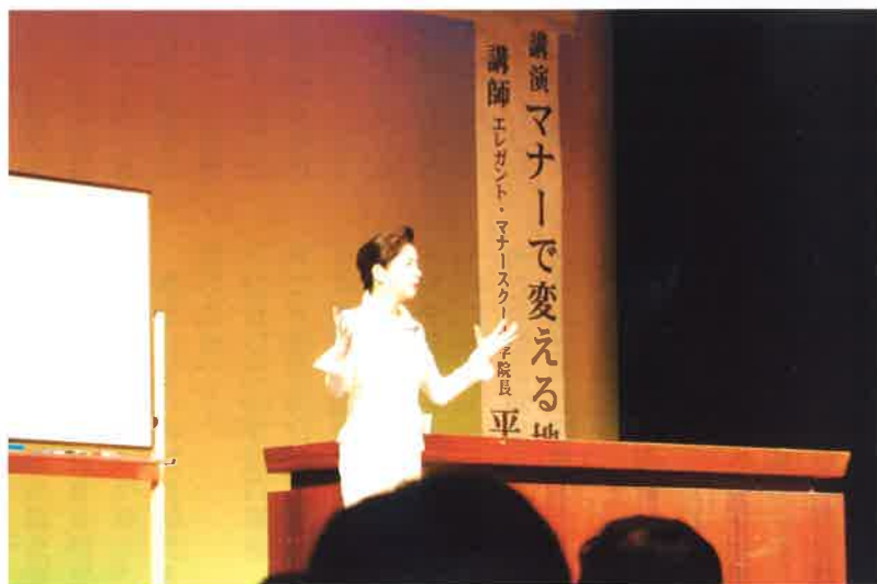
おもしろく、時には厳しく「接遇道」を熱く語られました