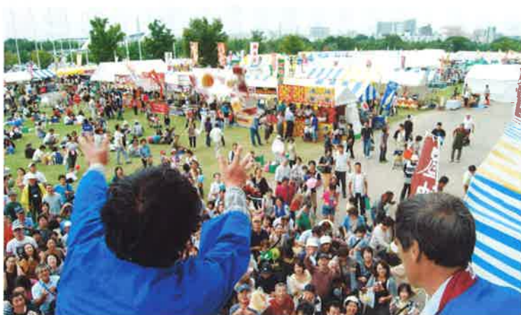
阿智の職人技にとよた産業フェスタのお客様も注目

十月二日〜三日は、区から九団体の出展があり、工業部会では阿智建築組合の皆さんを中心に長野県産材を使用したイベント用建物を造っていたいただき、豊田スタジアムにて棟上げ、上棟式、鏡割り、餅投げ、菓子まきを実施しました。両日、各一回の実演に多数の見物客が集まり、餅投げや菓子まきの時には混雑する中、大いに盛り上がりました。樽酒のふるまいもお代わりをする人がいて好評でした。建物に興味