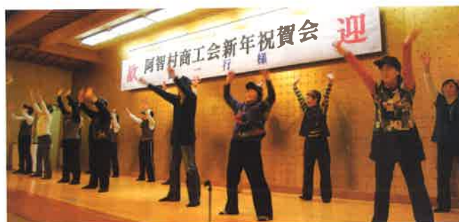
女性部は新年会でもパワー全開!!