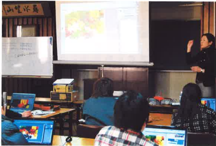
フォトショップ講座でプロの技を習得

今年度はヤフー㈱から講師を招いてのネットショップセミナーに始まり、今話題のツイッター講座を五回、フォトショップの基礎講座および応用講座を開催。村内外から多くの受講者が集まりました。