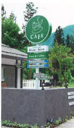
丸い看板が目印です

電 話／43-5501 ファックス／43-5501 営 業 時 間／午前11時30分～午後8時ラストオーダー 定 休 日／月曜日(祝日の場合は翌日に振替) 駐車場あり