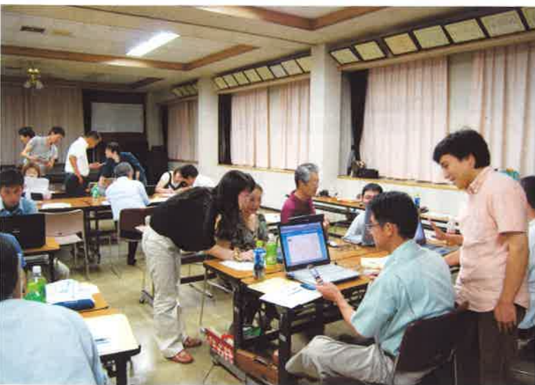
はじめてのツイッターを和気あいあいと勉強しました

の事業者の課題解決のための「専門家派遣事業」も現在までに延べ四十一回開催されております。商工会では新年度もさらにこれらの事業を拡充する予定ですので、会員の皆様のご活用をお願いいたします。