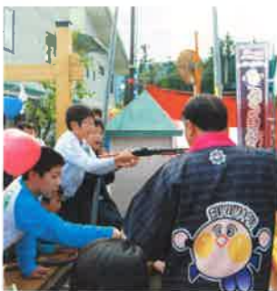
賑わうゲームやイベント。

の切り替え手続きをしていま せん。 旧カードから新カードへの ポイントの移行は今年三月三 十一日までとなっております。 せっかく今まで旧カードに沢 山ポイントを貯めていても、 今年の四月一日からは旧カー ドのポイント为新カードに移 行できないため、旧カードの ポイントが無駄になってしま います。一ポイントは一円と して使えます。 ぜひ忘れずに三月三十一日 までに旧カードから新カード への切り替え手続きを済ませ てください。