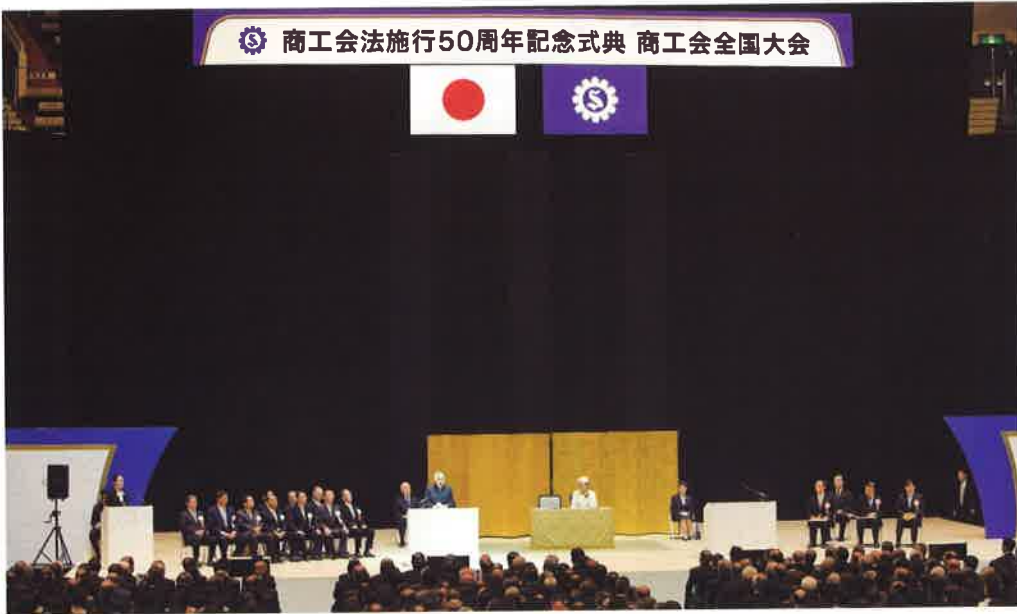
盛大に開催された記念すべき50周年記念式典