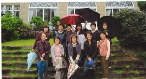
鳩山会館にて。雨でもにっこり

このような事を実践してこそ意味があると話されました。ひとつでも自分の事に取り入れる努力をしたいと思います。講演の後はホテル阿智川で新年会が行われ多くの会員さんの出席の中、村長さんをはじめ議長さん、信金の支店長さん