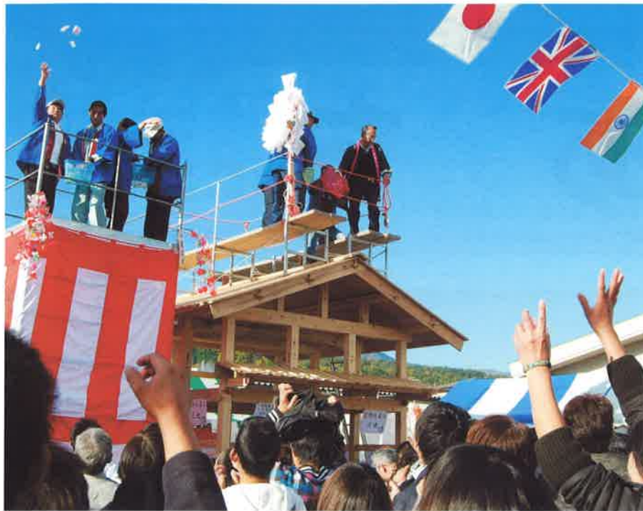
恒例の宝投げはやぐらと工建部の「建築」から盛大に!!

民の皆様の日頃のご愛顧へ感 謝する祭りとして、本年も元 氣よく煙火の合図で開会。恒 例のお太子講に続いて開会式 が終わると会場内には待ちに 待ったお客様が多数来場され、 おめでたい太鼓の演奏で賑や