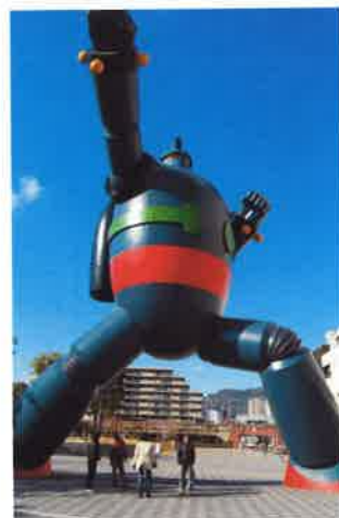
鉄人28号はやっぱり大きかった

例年のことながら青年部、女性部の余興がにぎやかに行われ、よい新年会ができました。今はいろいろな面で低迷する時代ですが女性のパワーで皆と手をつなぎ、仲良く事業をやっていききたいと思