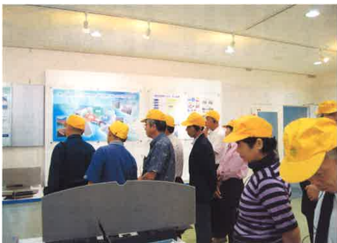
盟和産業岐阜工場で説明を聞く

ションより東海北陸道に入り、可児御嵩インターから五〜六km、御嵩町中心地より少し山の中の工業団地内に、広い敷地にゆったりと工場が建ち、ラインもほとんど自動化され、整然とした工場内で国内有名自動車メーカーの内装品が粛々と生産されていました。納品の