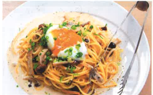
ゆったりとした店内でゆっくりとくつろいでいただけます

ちょっとした記念日や大切な人と行くときのお店としてブランブランをぜひご利用下さい。大切な食事のときには御予約をお勧めいたします。