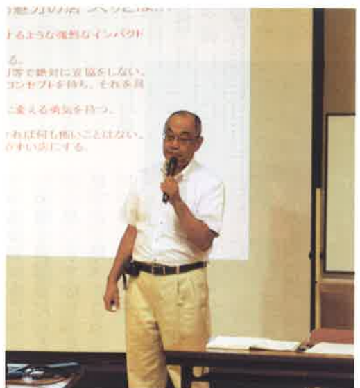
小売業も生き残るために熱心に受講

店づくりのためのノウハウを解説していただきました。さらに希望する個店には出向いて現場指導をいただき大変有意義な相談支援となりました。