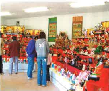
今年も多くのひな人形が並びました

特に新しくオープンした「清内路健康の森」での紅葉祭では地区内外の多くの皆様に商工会ブースをご利用戴きました。女性部の皆さんを中心に、健康の森食品加工所でのちまき作りなど合併前より引き続きの事業ですが、地区内のそれぞれの団体との連携を