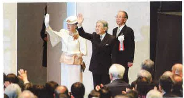
天皇皇后両陛下も御臨席されました