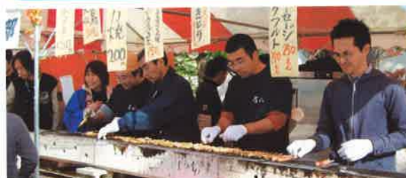
ひたすら焼きます! 青年部!!

私が部長になって今年度で二年目。部長としての青年部活動は最後の年ですのでより一層充実した事業ができるように部員一同がんばっております。